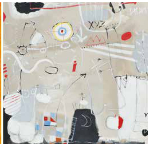
A la izquierda, Ofrenda del viento, por Rora Mascarell, temple al huevo y oro sobre tabla, foto de Xavier Mollà, y The world is in your head, por Sieglindé Battley, acrílico sobre lienzo.